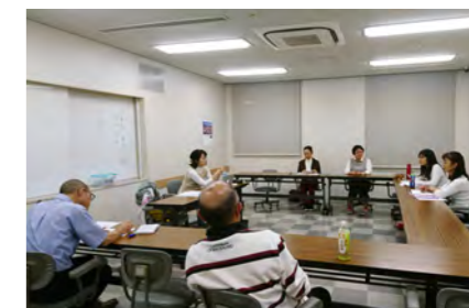
平成29年度アートな学び舎 「戯曲を読み解く! 2017」講座風景