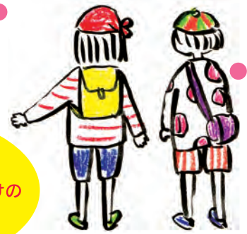
※この公演は、靴をぬいでご入場・ご鑑賞いただけます。

いまま、いまま、たったいま、 ココにはたくさんのお本がちらかっている、 絵本の世界から、 赤ずきんちゃん、 桃太郎、 飛び出してきた! 踊りだす! おんぶと一緒に。ことばと一緒に。 のぞいてみよう! 参加しよう! たったいまの、わたしたちの物語。