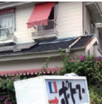
2 ポ・ト・フー (家庭フレンチ)