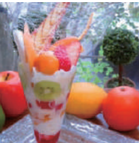
6 杏カフェ (ランチ/夜カフェ)