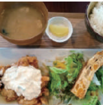
1 花の飯屋 (うどん/定食)