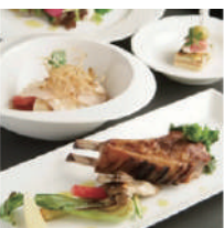
ベルエボック (フレンチ) 音楽祭のみ