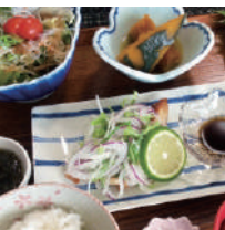
9 うらら香 (和食カフェ)