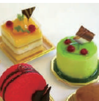
8 リューヌ・ド・ プランタン (スイーツ)