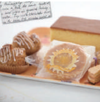
5 エム・ブルー (フランス菓子)