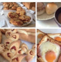
10 パンドール (パン)