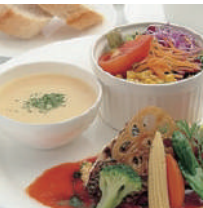
4 レミューズ (イタリアン/フレンチ)