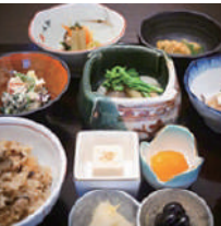
3 チャゴ (精進料理)