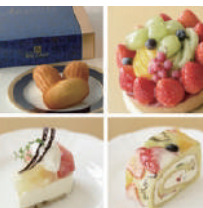
7 ブランダジュール (フランス菓子)